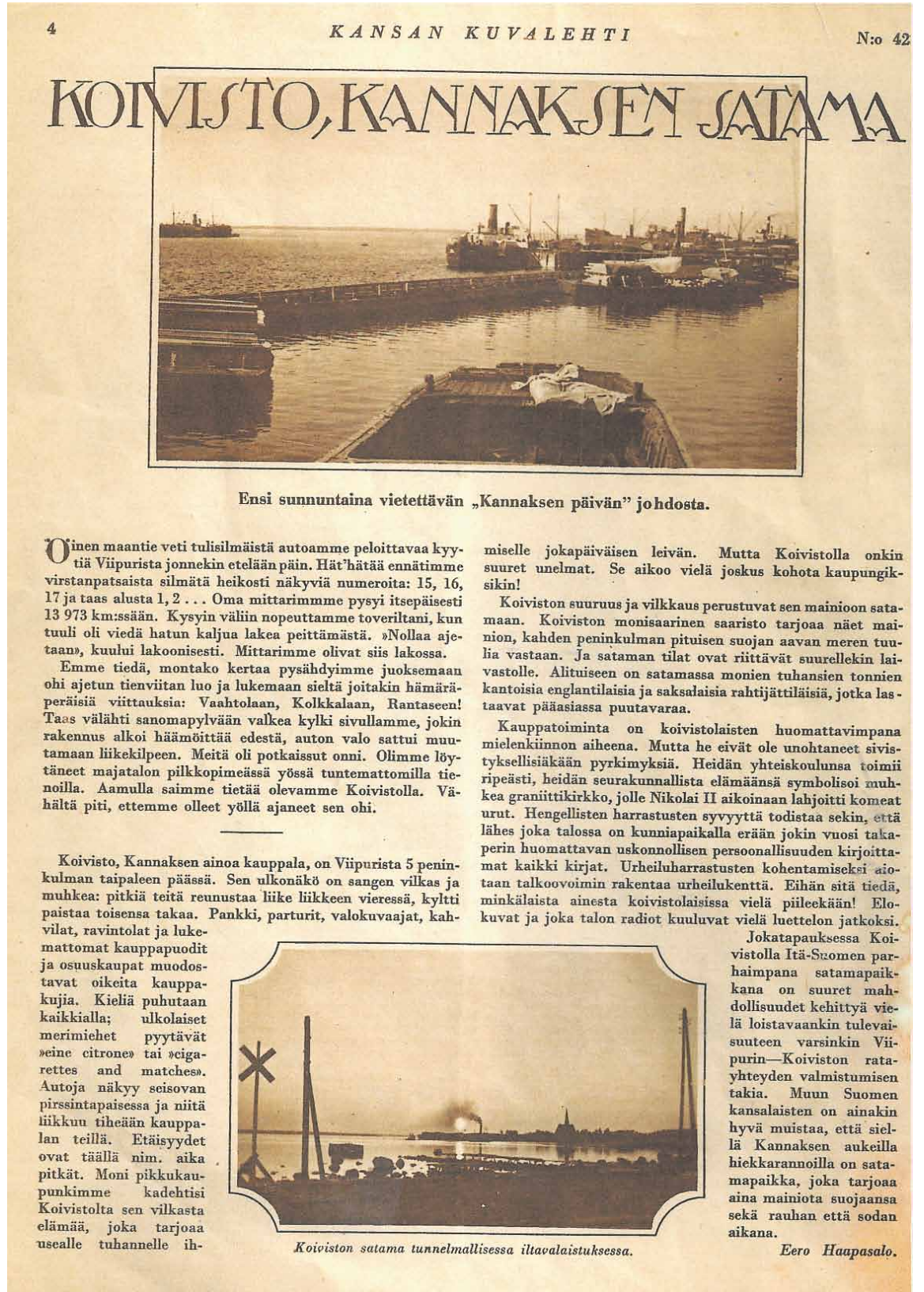
Ensi sunnuntaina vietettävän „Kannaksen päivän” johdosta.

Oinen maantie veti tulisilmäistä autoamme peloittavaa kyytiä Viipurista jonkekin etelään päin. Hät'hätää ennätimme virstanpatsaista silmätä heikosti näkyviä numeroita: 15, 16, 17 ja taas alusta 1, 2... Oma mittarimme pysyi itsepäisesti 13 973 km:ssään. Kysyin väliin nopeuttamme toveriltani, kun tuuli oli viedä hatun kaljua lakea peittämästä. »Nollaa ajetaan», kuului lakoonisesti. Mittarimme olivat siis lakossa.