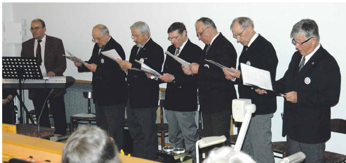
Jaalamiehet johdattivat yleisön 70 vuoden takaisin tunnelmiin