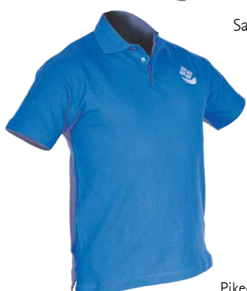
Pikee paita 16,50€