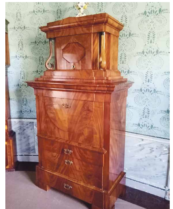
Kokkalan kaappi, josta saa avattua työtason.