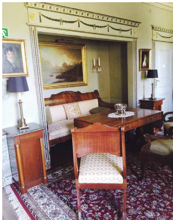
Kokkalan huonekaluja isännän huoneessa.