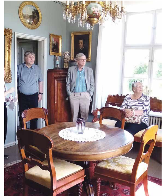
Entinen lastenhuone sisustettu kokonaan Kokkalan lahjoituksilla.

heisesta historiasta monine omistajineen ja lähes tunnin kestäväällä kierroksella 12 kunnostettua huonetta kahdessa kerroksessa tulivat tutuksi. Kuvaaminen on sallittua kartanossa, joten ikuistimme tarkkaan Kokkalan lahjoitukset, joista opas meille myös auliisti kertoi.