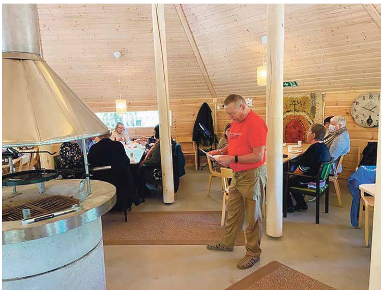
Porvoon s. Karjalaisten varapuheenjohtaja selvittää kisaajille Mөлkkyy-kisan säännöt Sikilän tapaamisessa