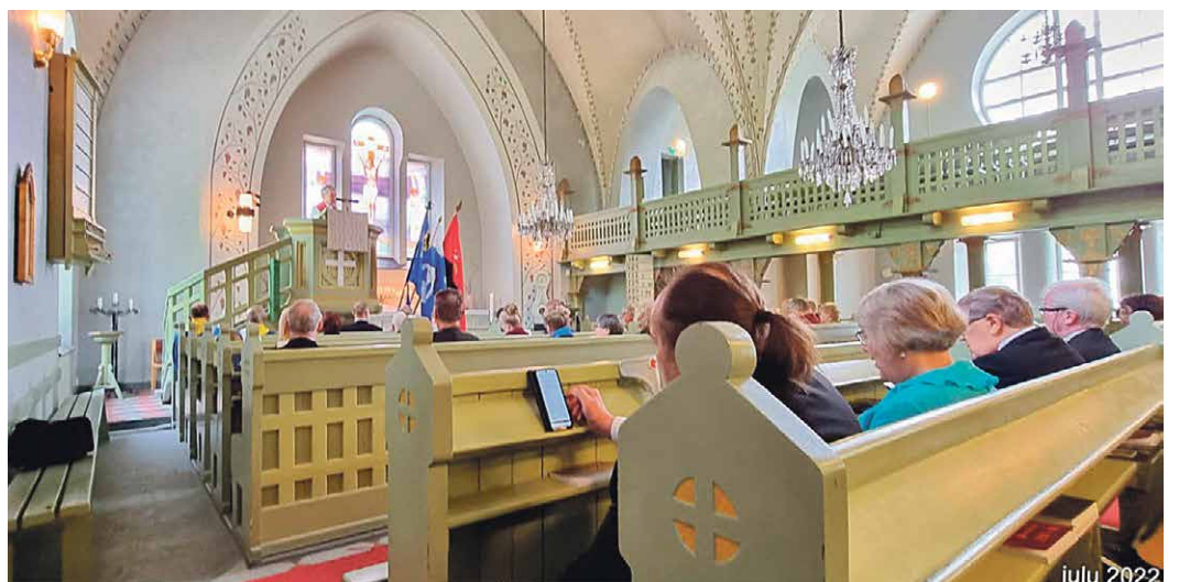
Sisäkuvaa kirkosta. Meneillään Jumalanpalvelus.