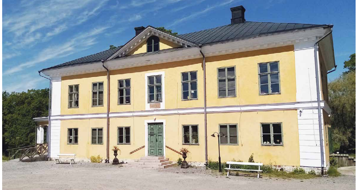
Brinkhallin kartanon päärakennus.

Seuraavaksi siirryimme päärakennuksen ovelle, jossa reipas nuori opas kertoi tilan historiasta ja rakennuksista. Sisäpuolella saimme tietää lisää kartanon monivai-