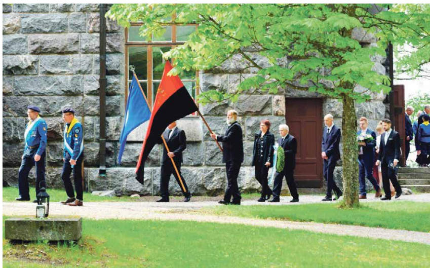
Lippuvartio tulee kirkosta muistolaatan paljastuspaikalle.