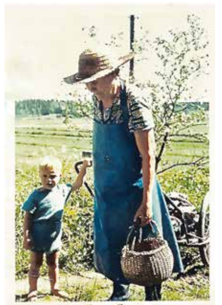
Äiti ja tyttärenpoika