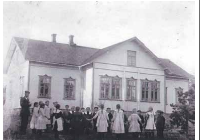
Kuirlahden ja Soukan yhteinen kansakoulu

Kirkko ol mäe pääl, joka ol paha kiivetä ylös. Äitiki nahkakenkissään män polvilee rintees. Kirko pihal ol paljo väkkee. Kirkos istuttii penkis. Virsii ku veisattii ni se tuntu mukavalt, mut ku pappi rupes saarnaama ni sit miulle kävi aika pitkäks. Kirko lattiaa tutkin ja sen muistan minkälaine vähä huonokuntone se ol, mut papi saarnast en muista mittää.