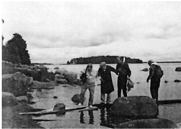
Eistilän ranne nousu.