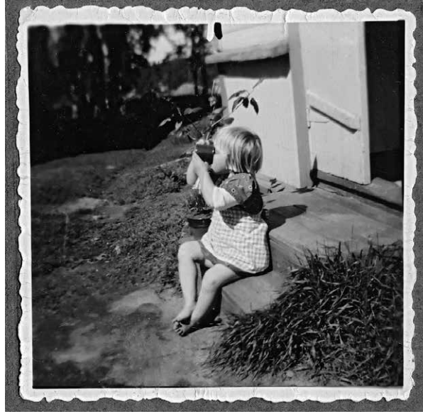
Kärpästen hotelointiapalkka. Mukillinen lämmintä maitoo.