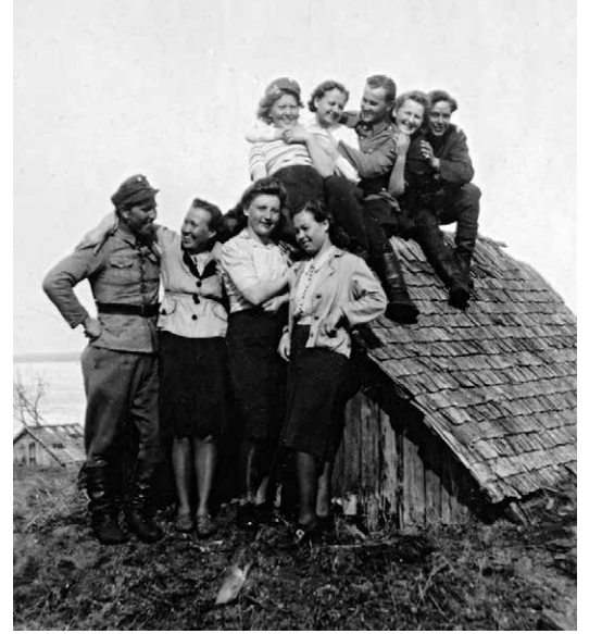
Nuoret perunakuopan katolla 1942.

”Ota kuva vast sit ko mie oon tään maijon juont.”