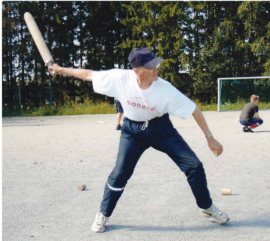
Kyykkämestari näyttää tyylää Porvoon Linnamäen Vesilaitoksen kentällä Porvoon Koivistolaisten muille johtokunnan jäsenille. (Kaikki osasivat onneksi suojautua, kun tuli minun vuoroni heittää.)

karjalaiseen tapaan suurperheeksi niin, että lapsia oli lopulta yhdeksän - viisi poikaa ja neljä tyttäretä.