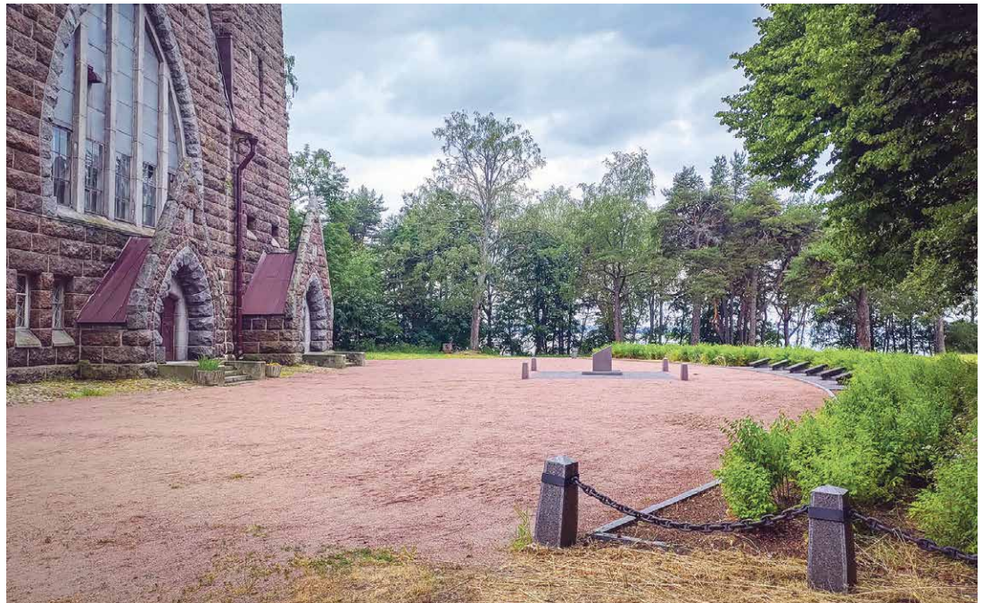
Koiviston kirkko ja sankarihauta-alue 28.6.2021.

Mittasimme hautausmaan sijainnin käyttäen apuna vanhoja sankarihautausmaan kuvia ja Suomen kansallisarkistosta löytynyttä kirkkopihan karttaa, määrittelimme sankarivainajien lukumäärän ja henkilötiedot Koiviston seurakunnan historiakirjoista. Suunnittelimme yhdessä venäläisten osapuolien kanssa hautausmaan restauroinnin piirustuksineen. Venäläiset tekivät hauta-alueen lopullisen määrittelyn ja kunnostussuunnitelman sekä hoitivat hyväksynnät. Venäläiset viranomaiset ilmoittivat, että sankarihaudan kunnostus tehdään osana Koiviston kirkon ja sen ympä-