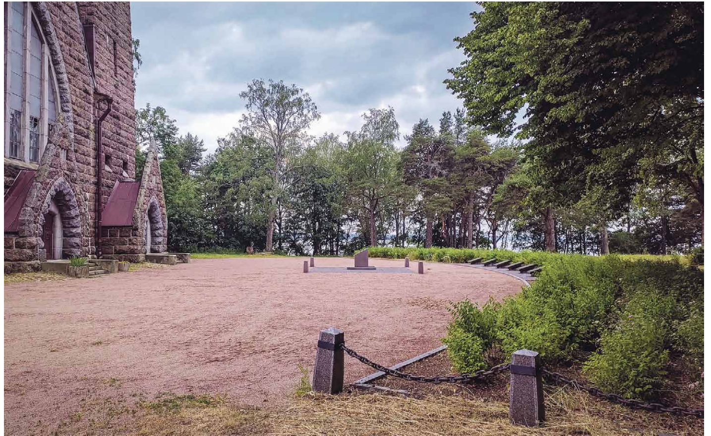
Koiviston sankarihautausmaa kesällä 2021.

Kotiseurakuntansa kirkkomaahan siunatuille sankarivainajille kuuluu hautarauha.